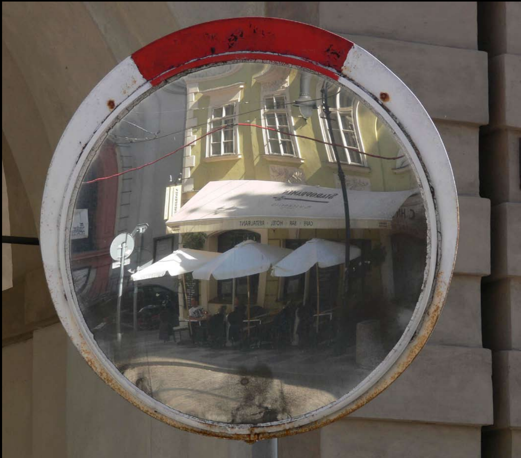
Straßenkafe auf der Prager Kleinseite