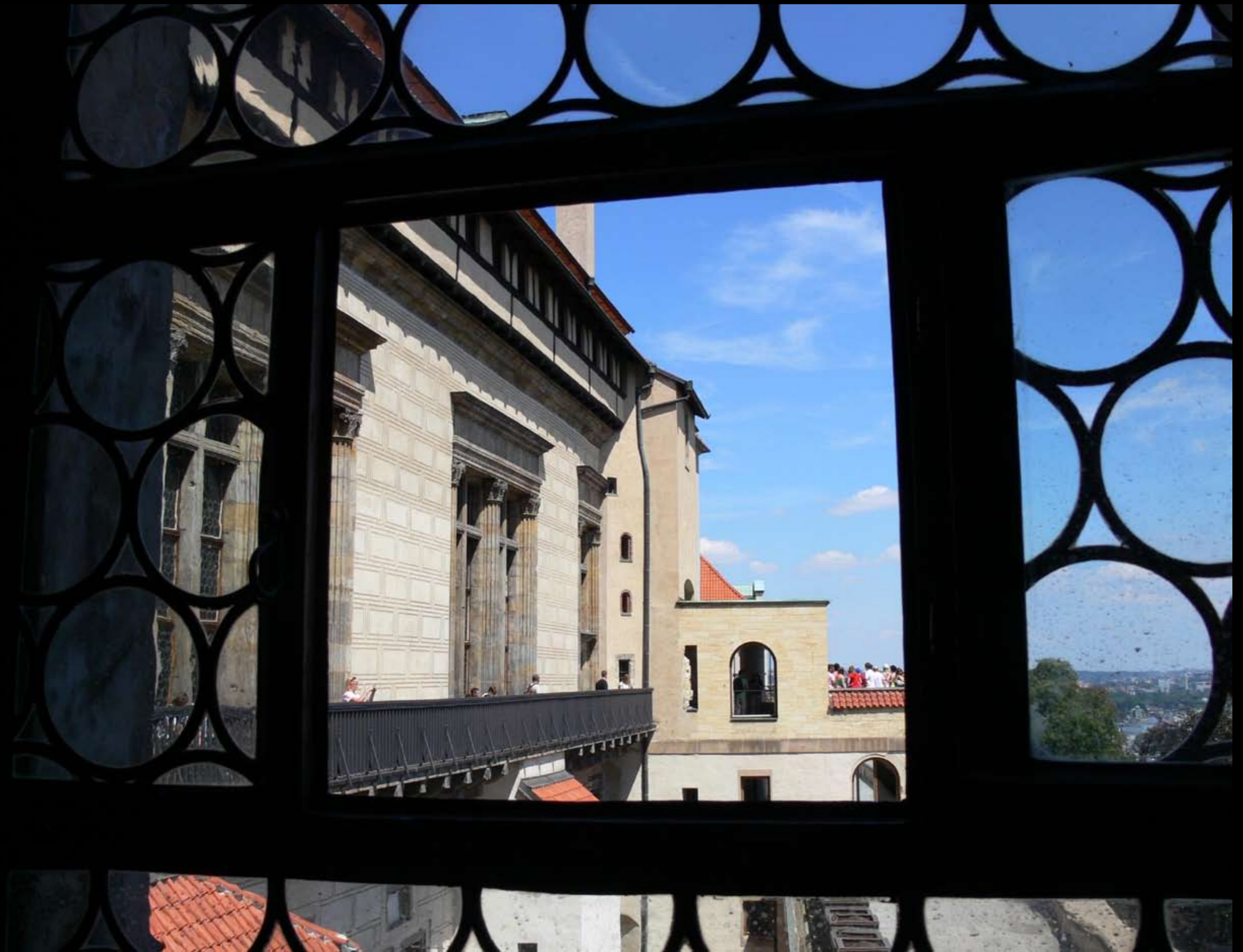
Blick aus dem alten Königspalast