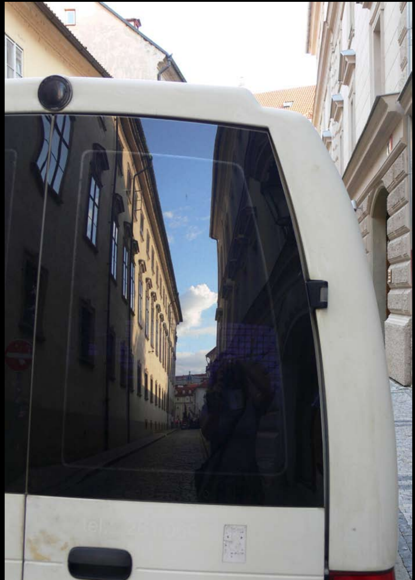
Prager Gasse auf der Kleinseite