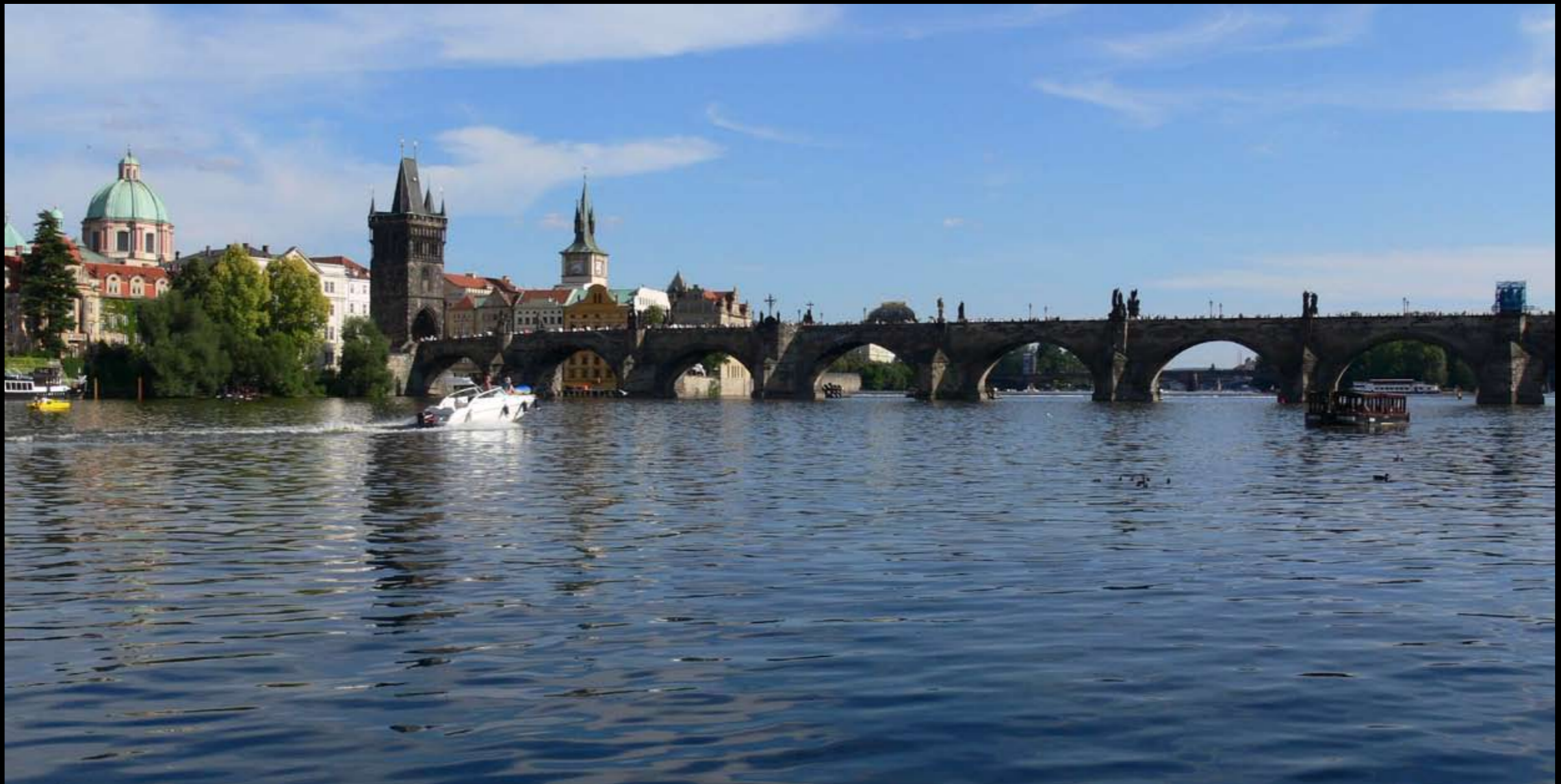
Karlsbrücke am 16. Juli nachmittags 17.00 Uhr