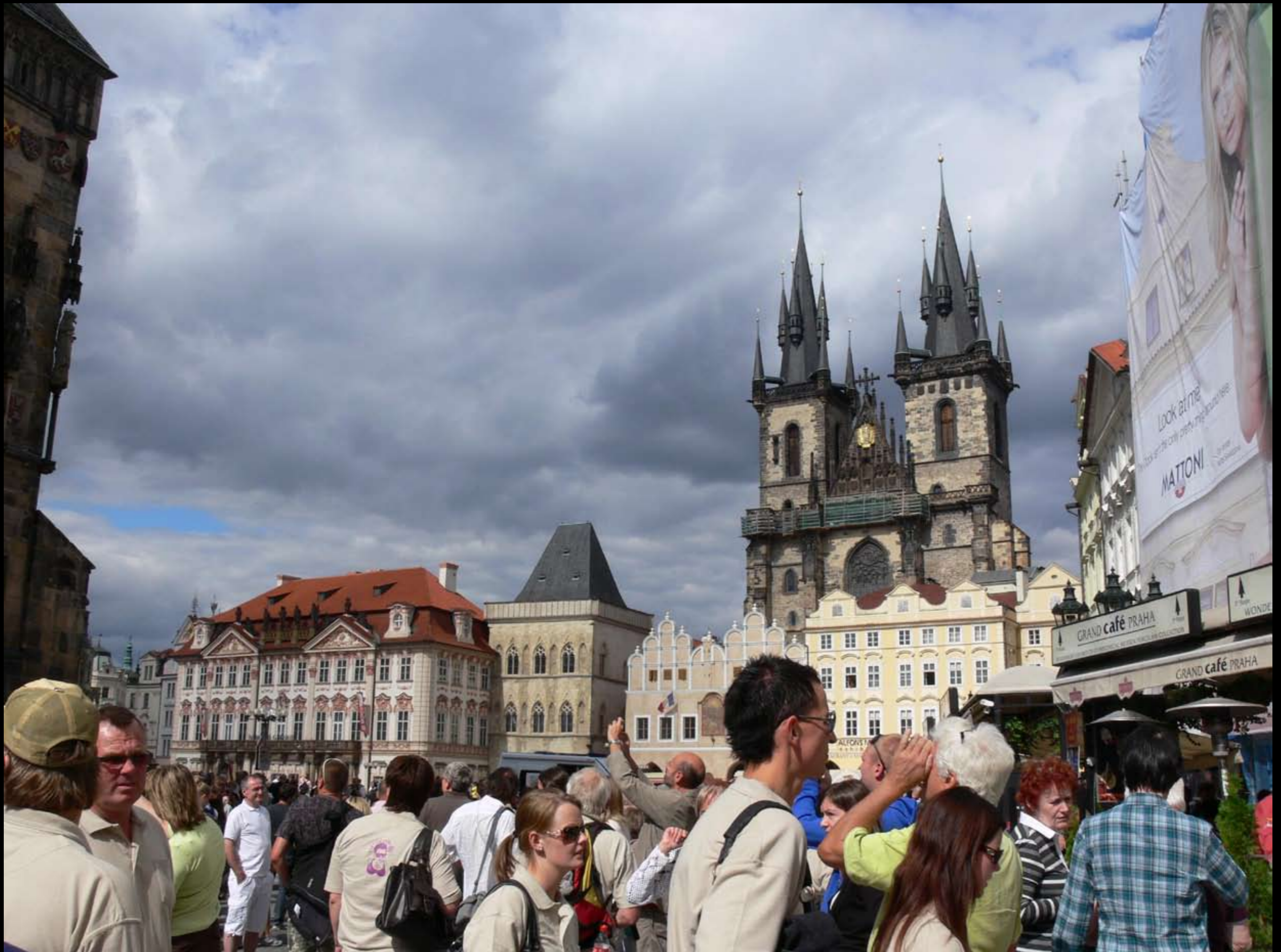
Altmarkt mit Teinkirche