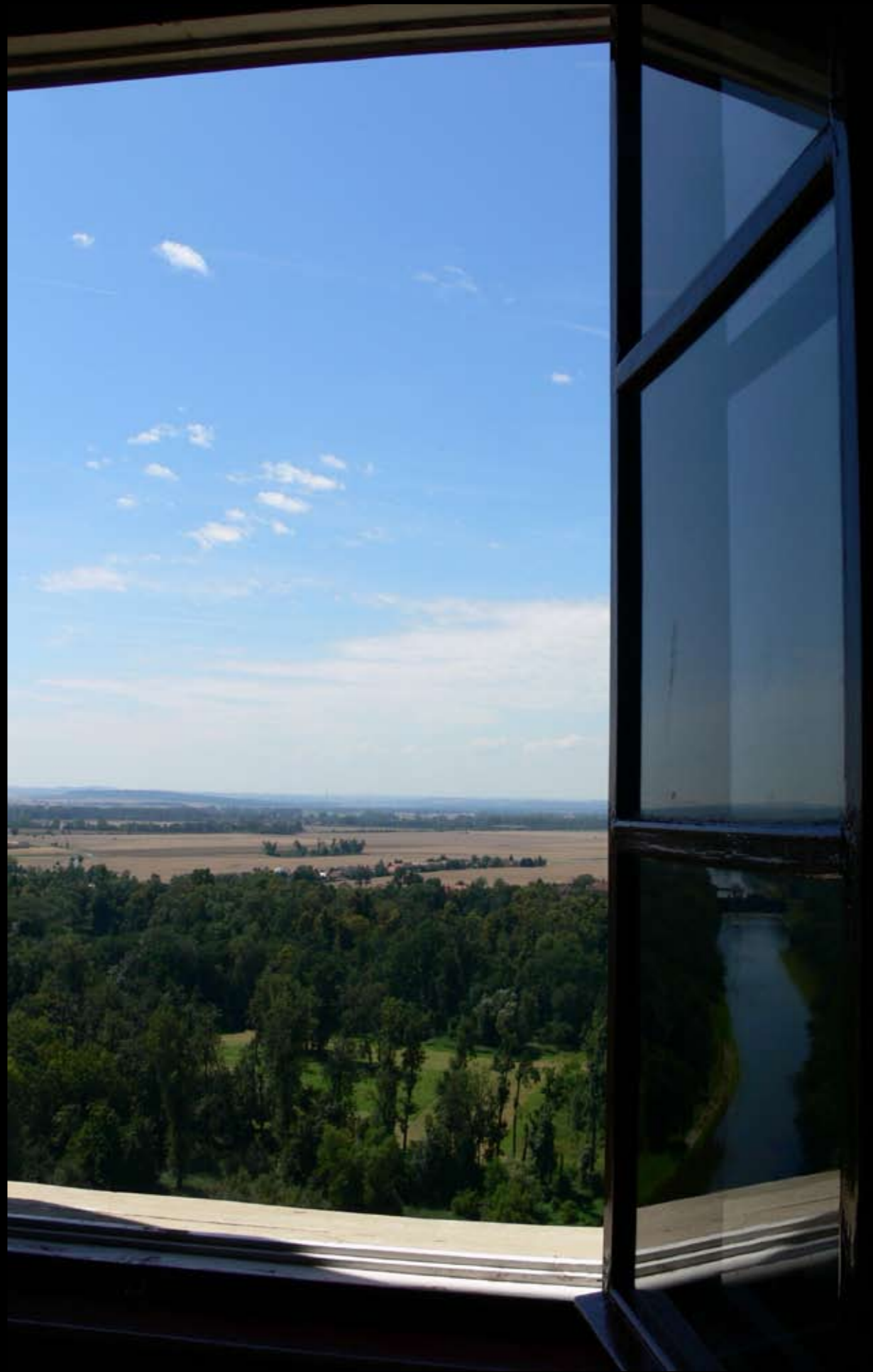
Der Moldaukanal in Melnik