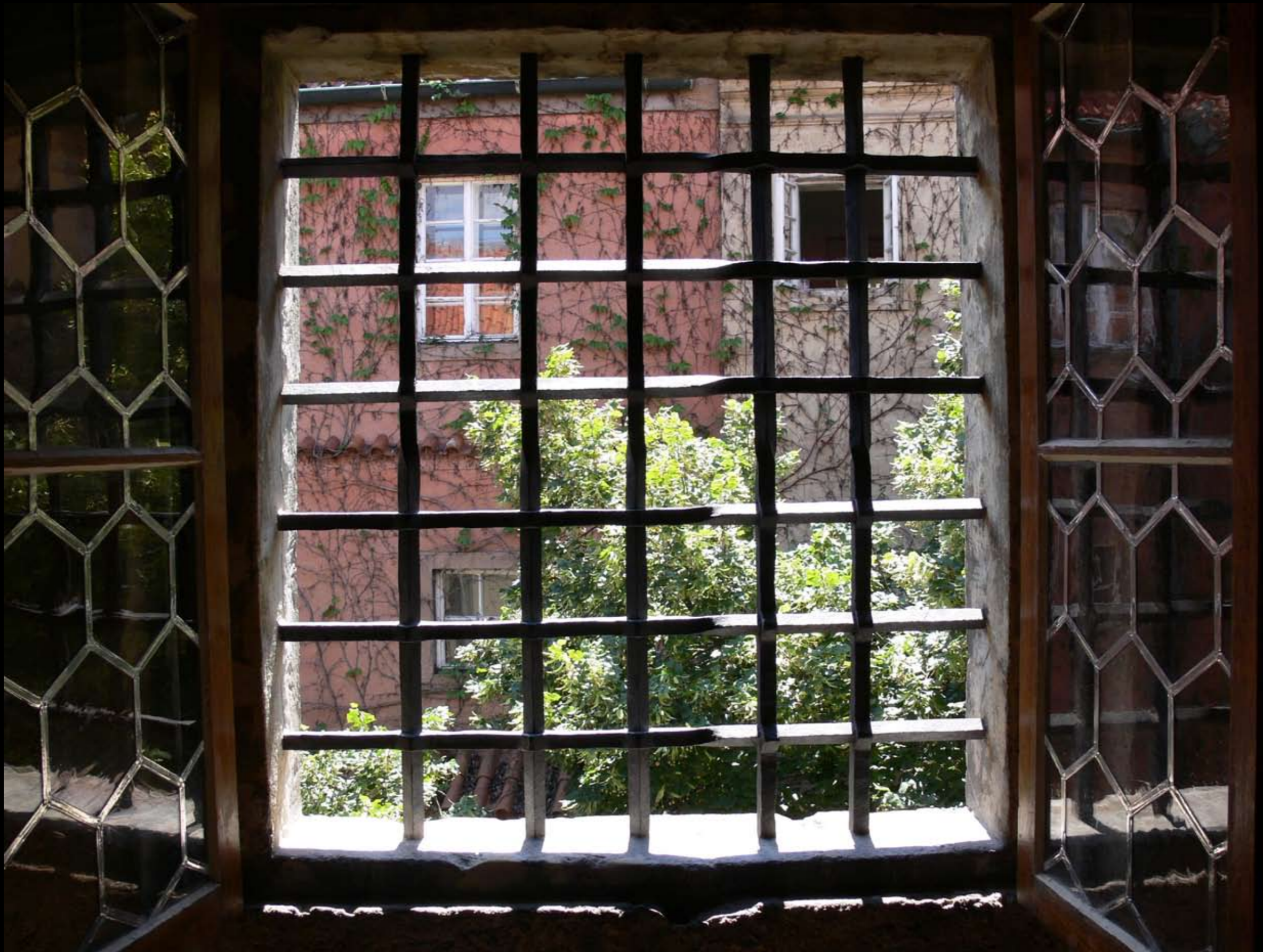
Blick auf ein Burgfenster