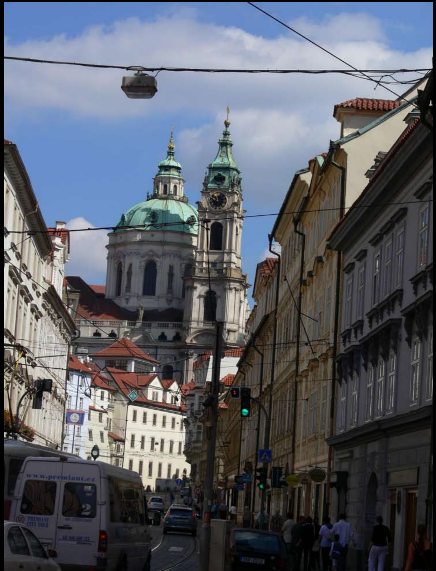
Blick zur St.-Nikolaus-Kirche auf der Kleinseite