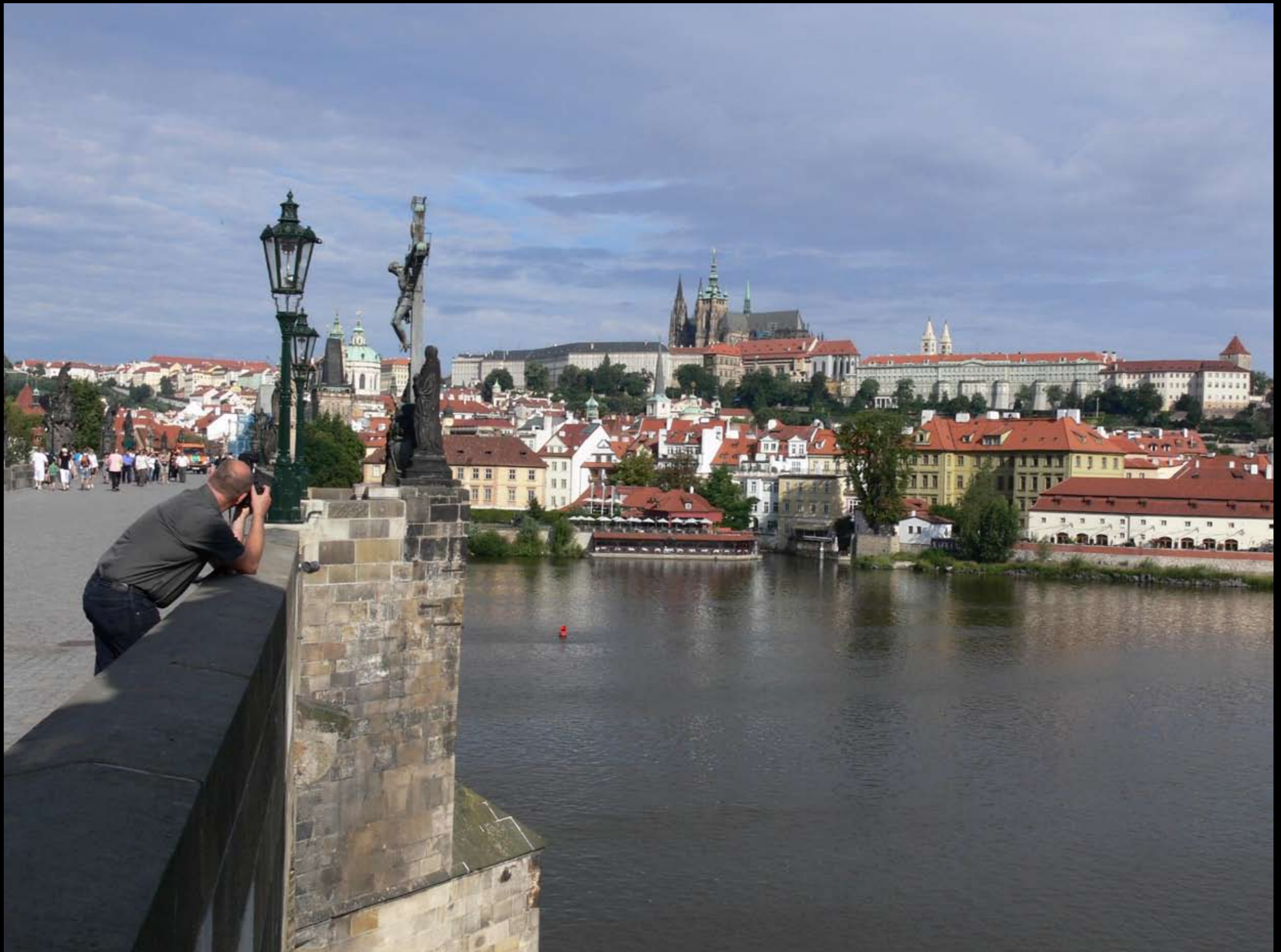
Blick von der Karlsbrücke zur Prager Burg