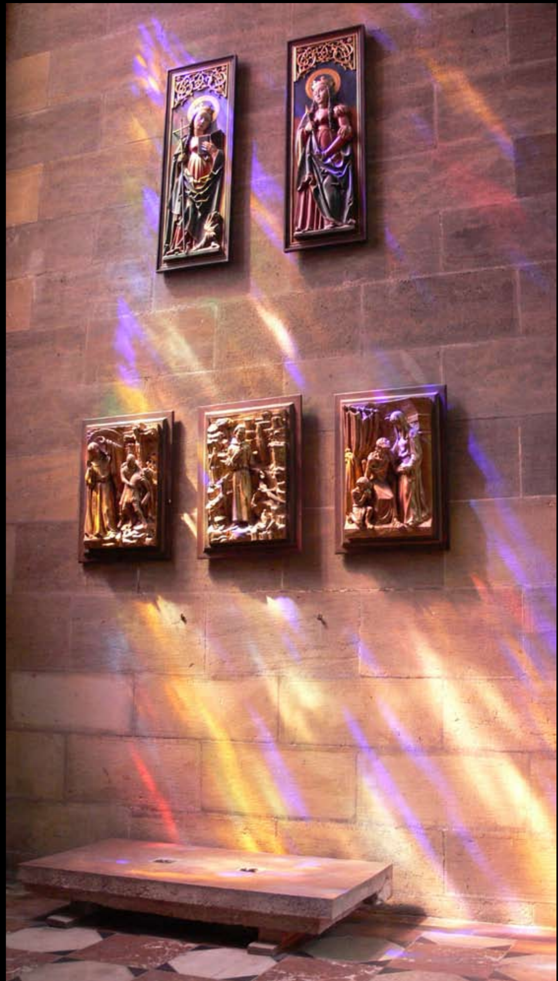
Lichspiel im Veitsdom