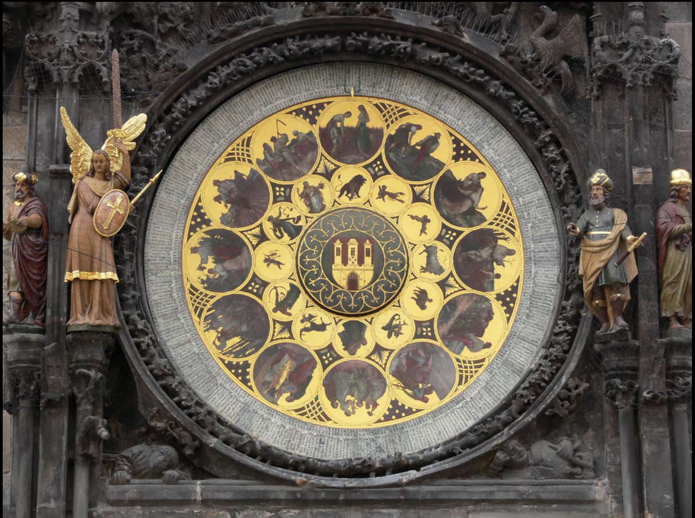
Kalendarium mit Tierkreiszeichen an der astronomischen Aposteluhr am Altstädter Rathaus