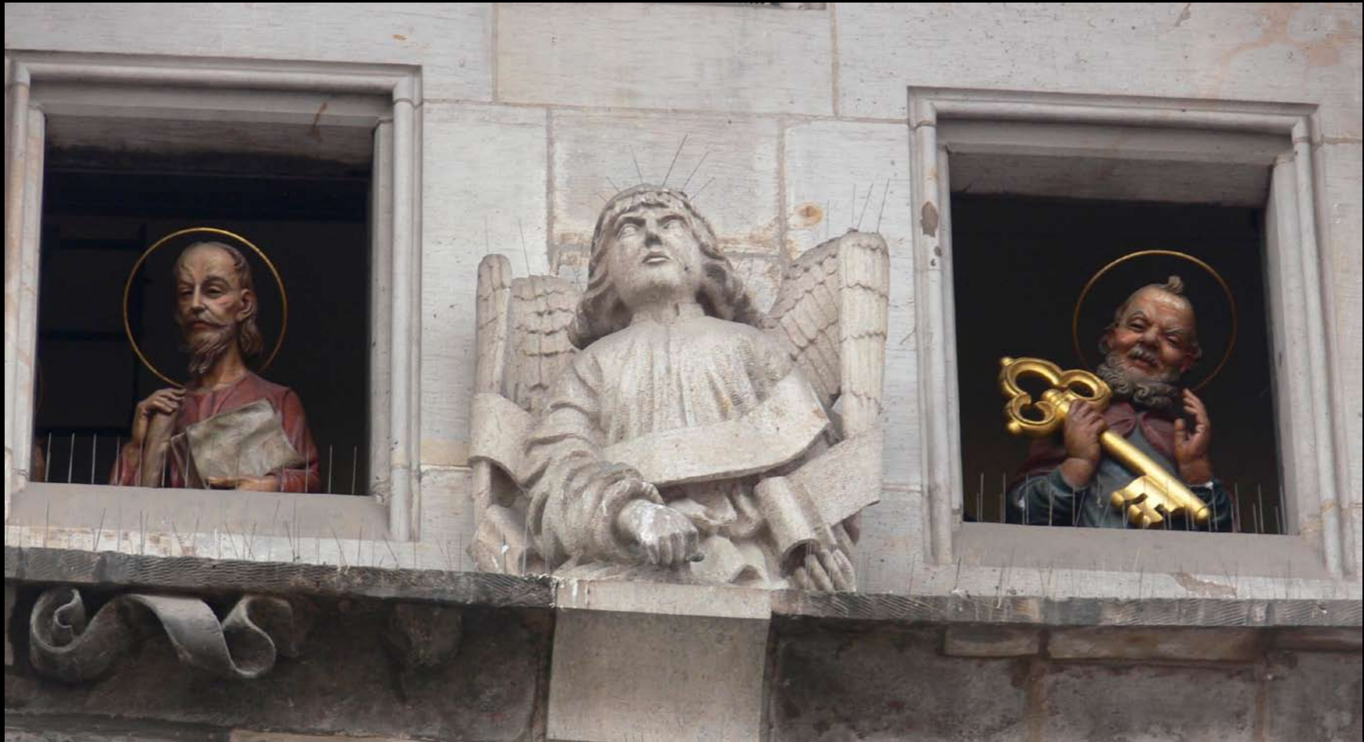
2 Apostel von 12, die zu jeder vollen Stunde an der astronomischen Uhr erscheinen