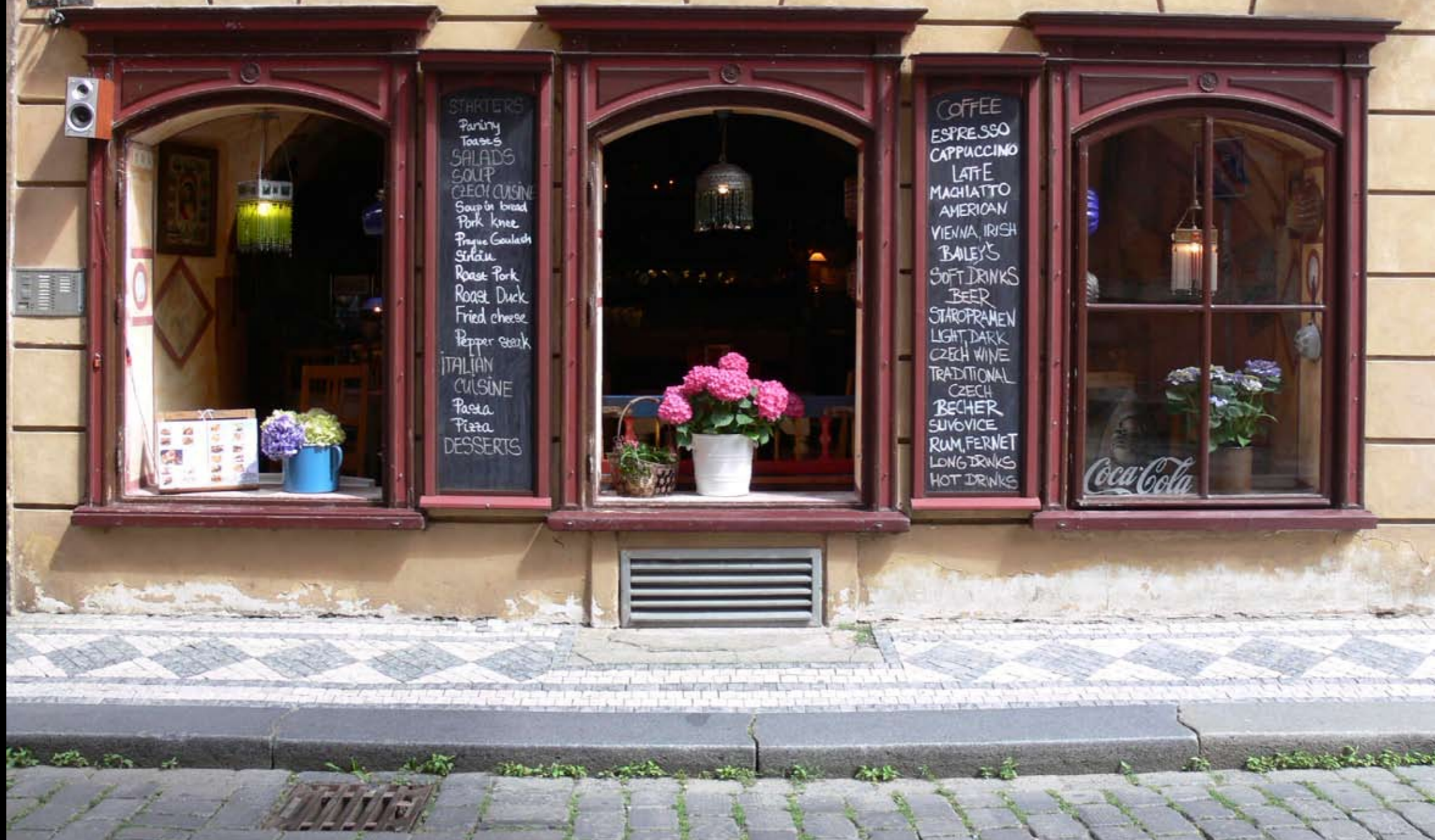
auf der Prager Kleinseite