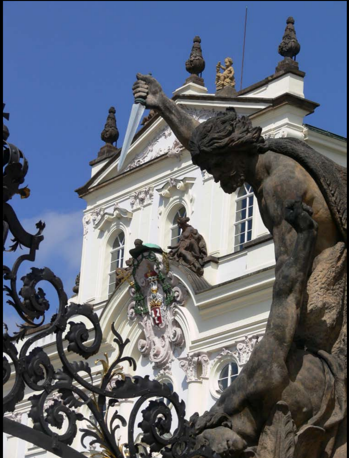
Detail am Eingang zur Prager Burg