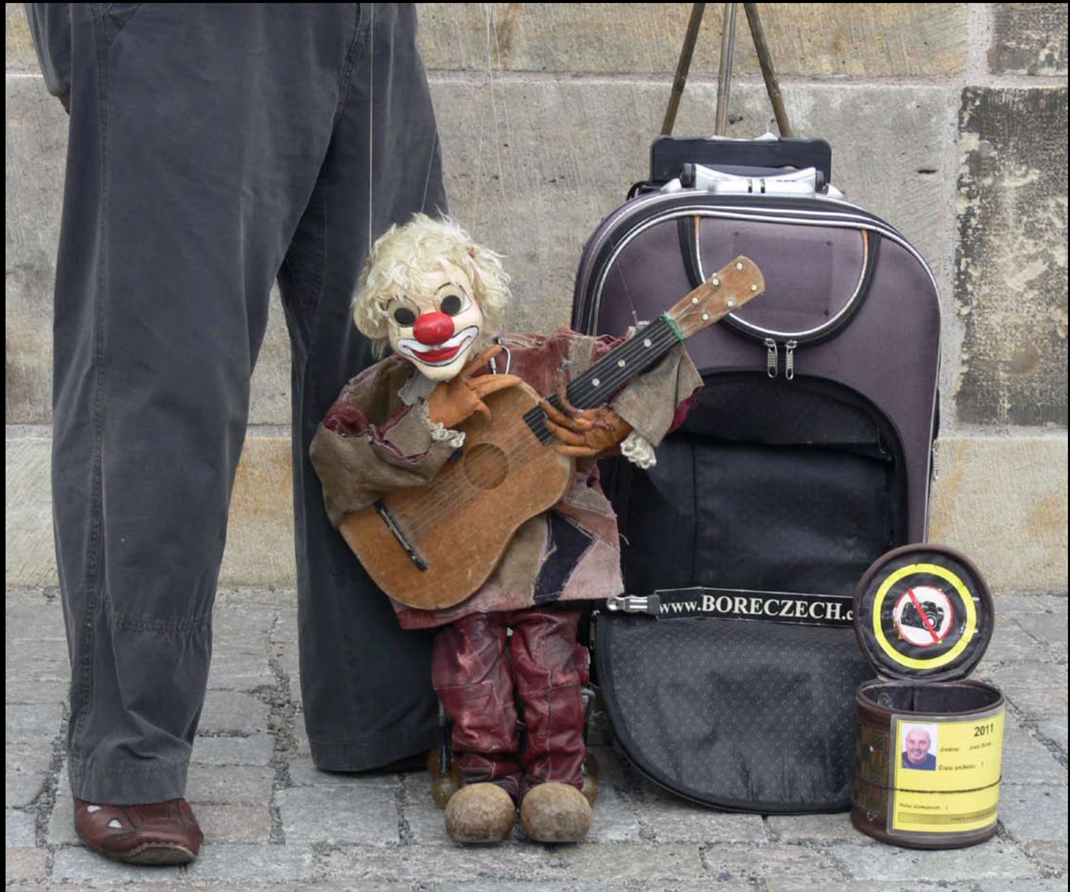
ein Musiker auf der Karlsbrücke