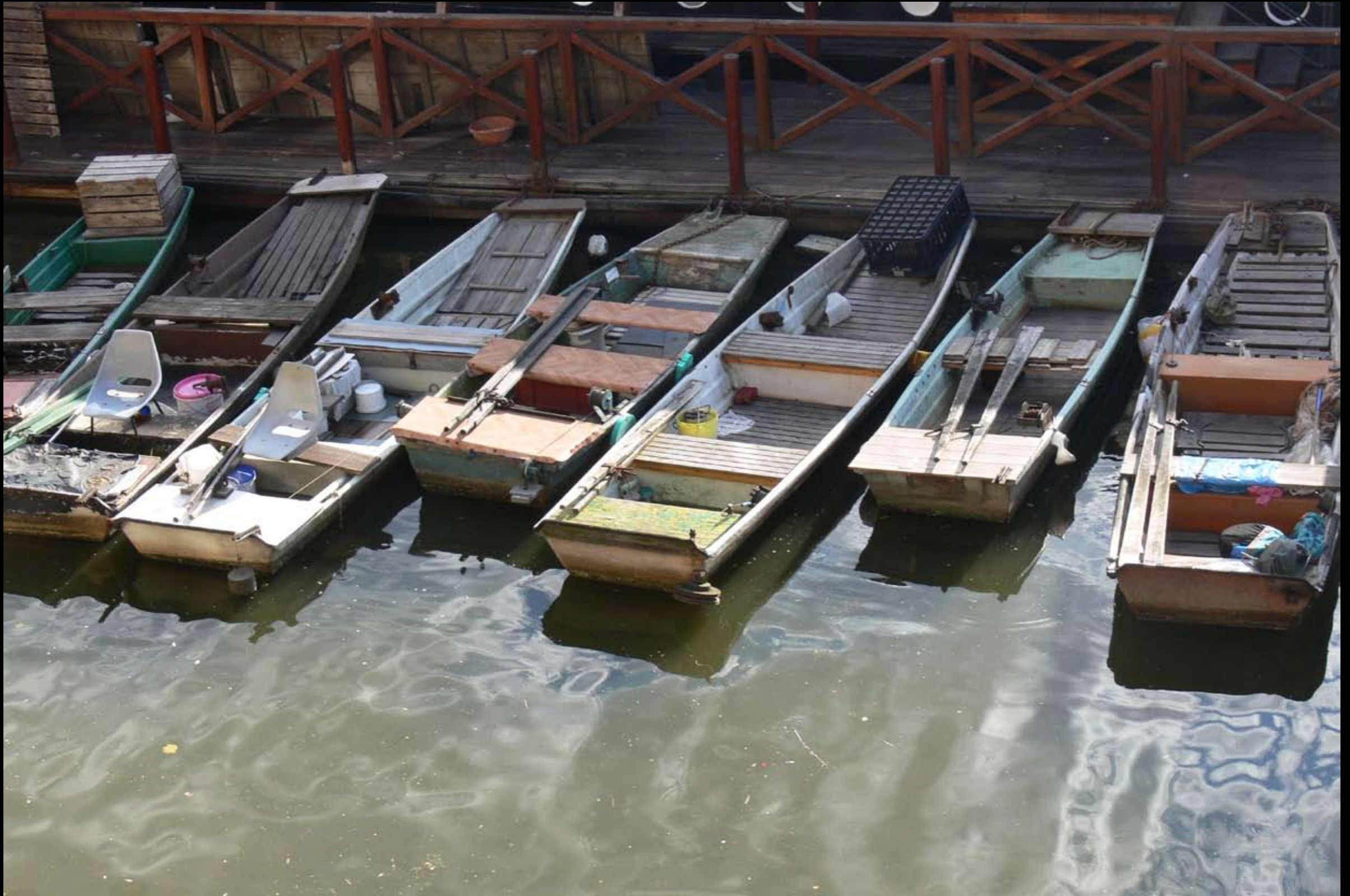
Anglerboote an der Karlsbrücke