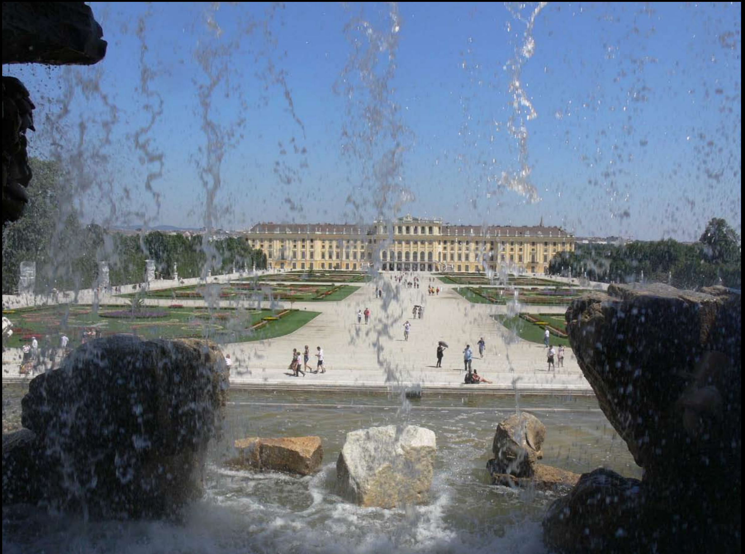
Blick vom Neptunbrunnen auf Schloss Schönbrunn