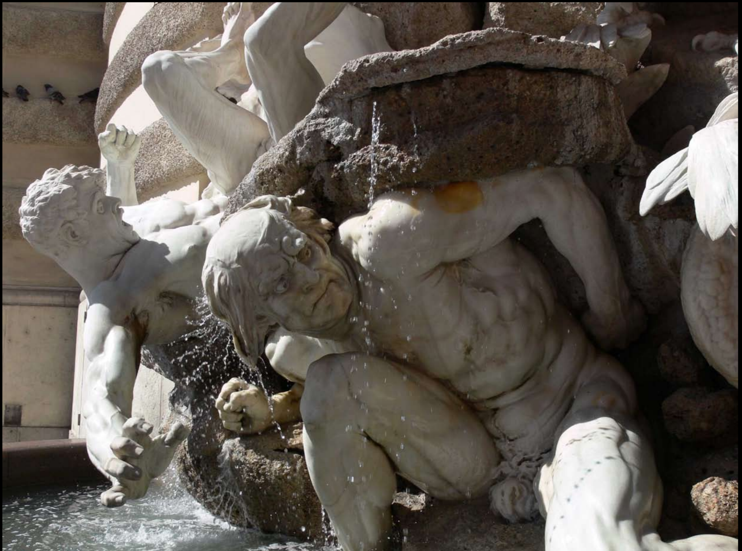
Detail vom Brunnen an der Hofburg