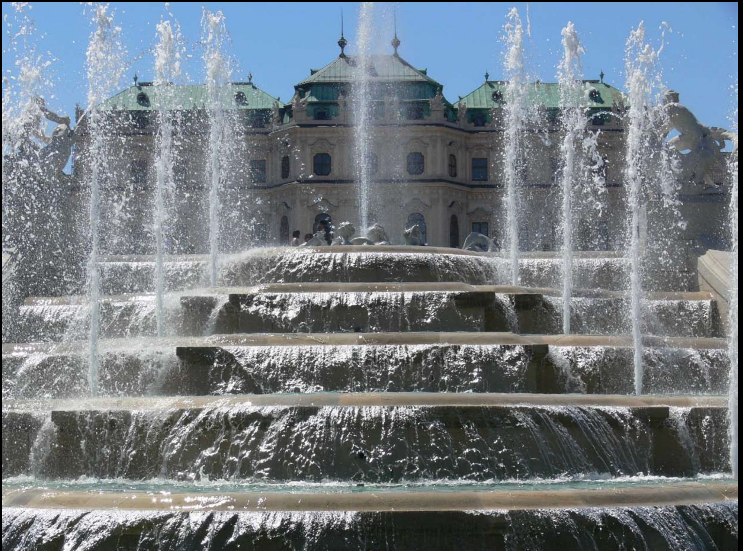
Blick aufs obere Belvedere Schloss