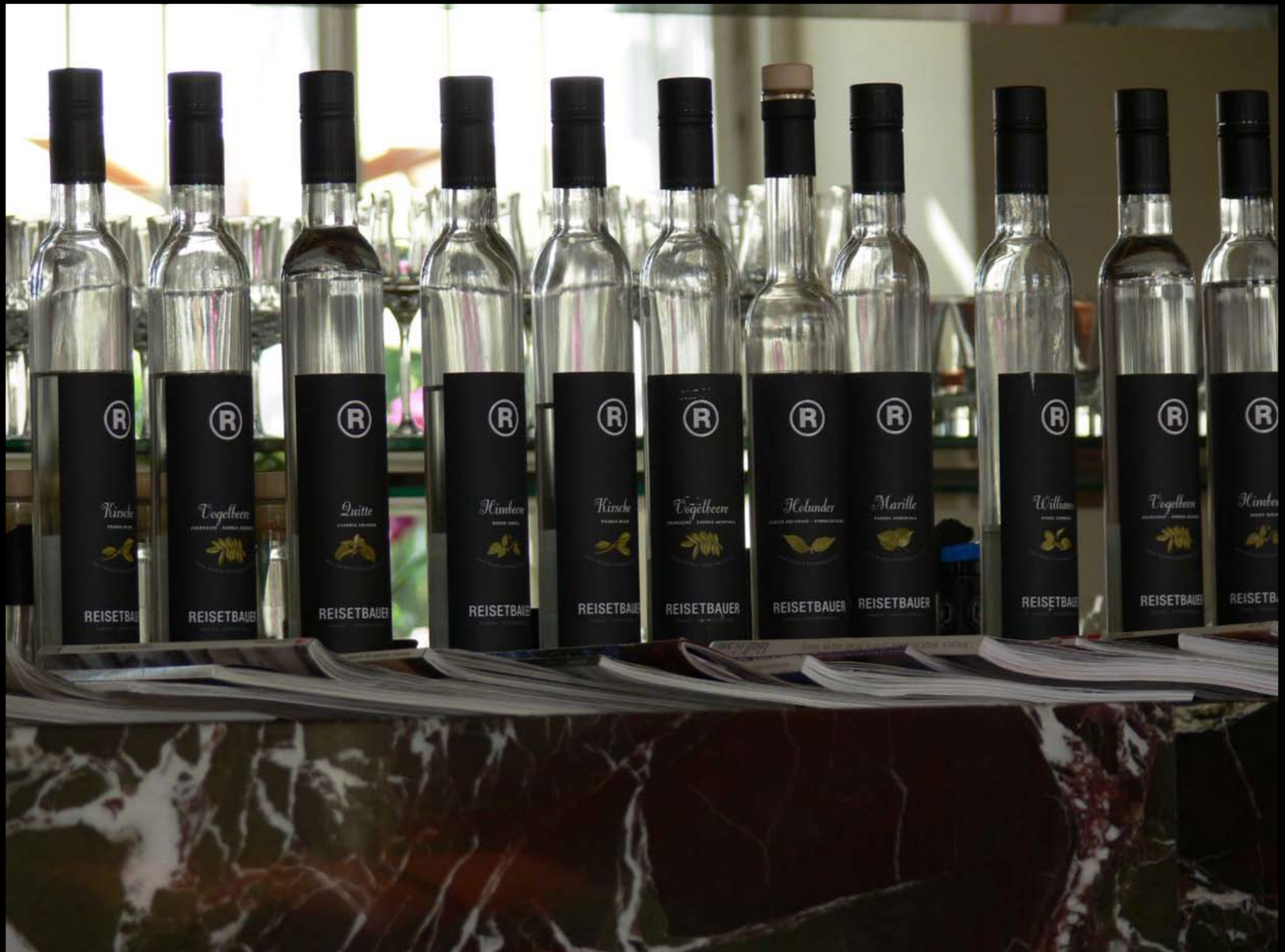
Kunst im Albertina-Cafe