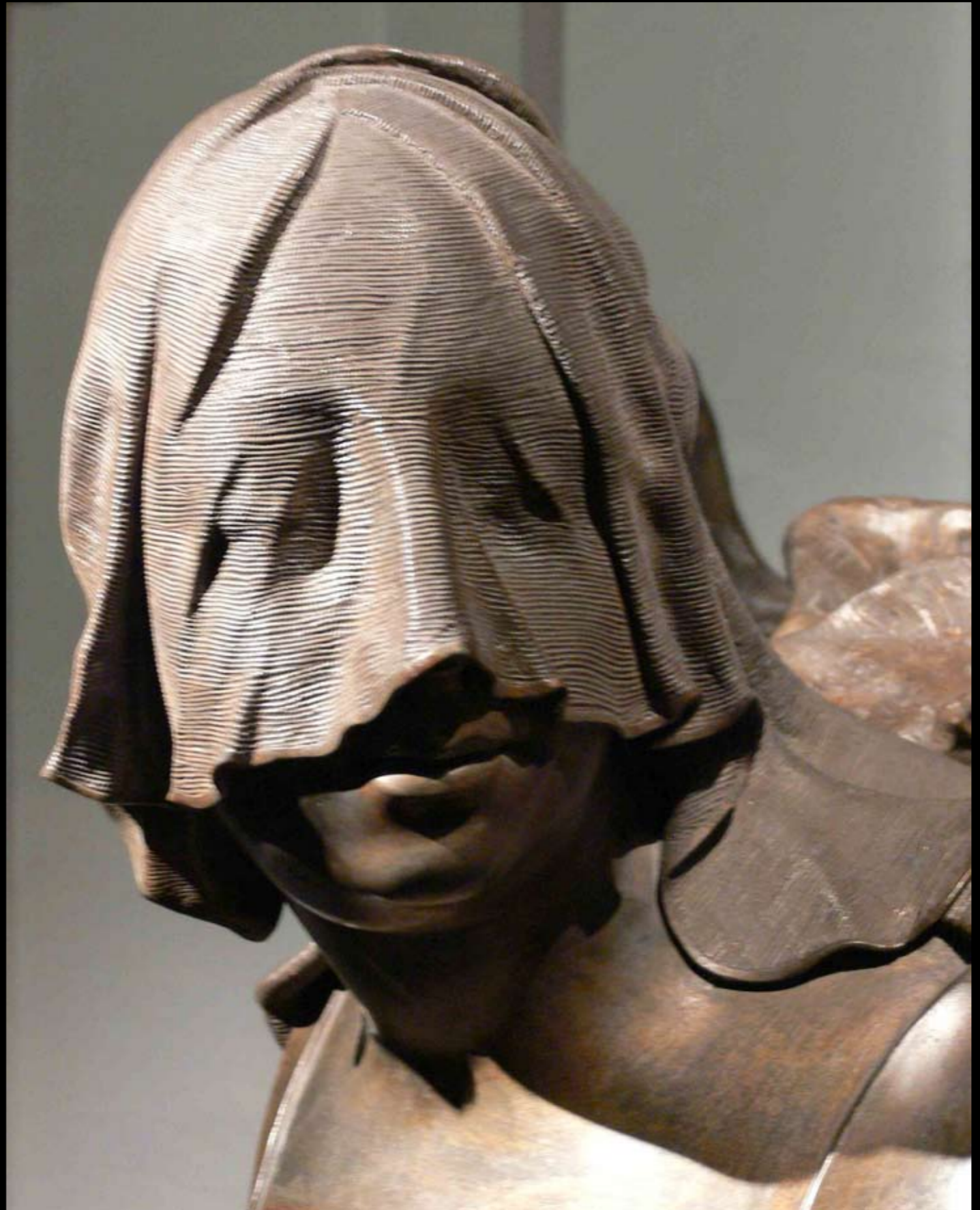
Detail aus der Gruft der Habsburger