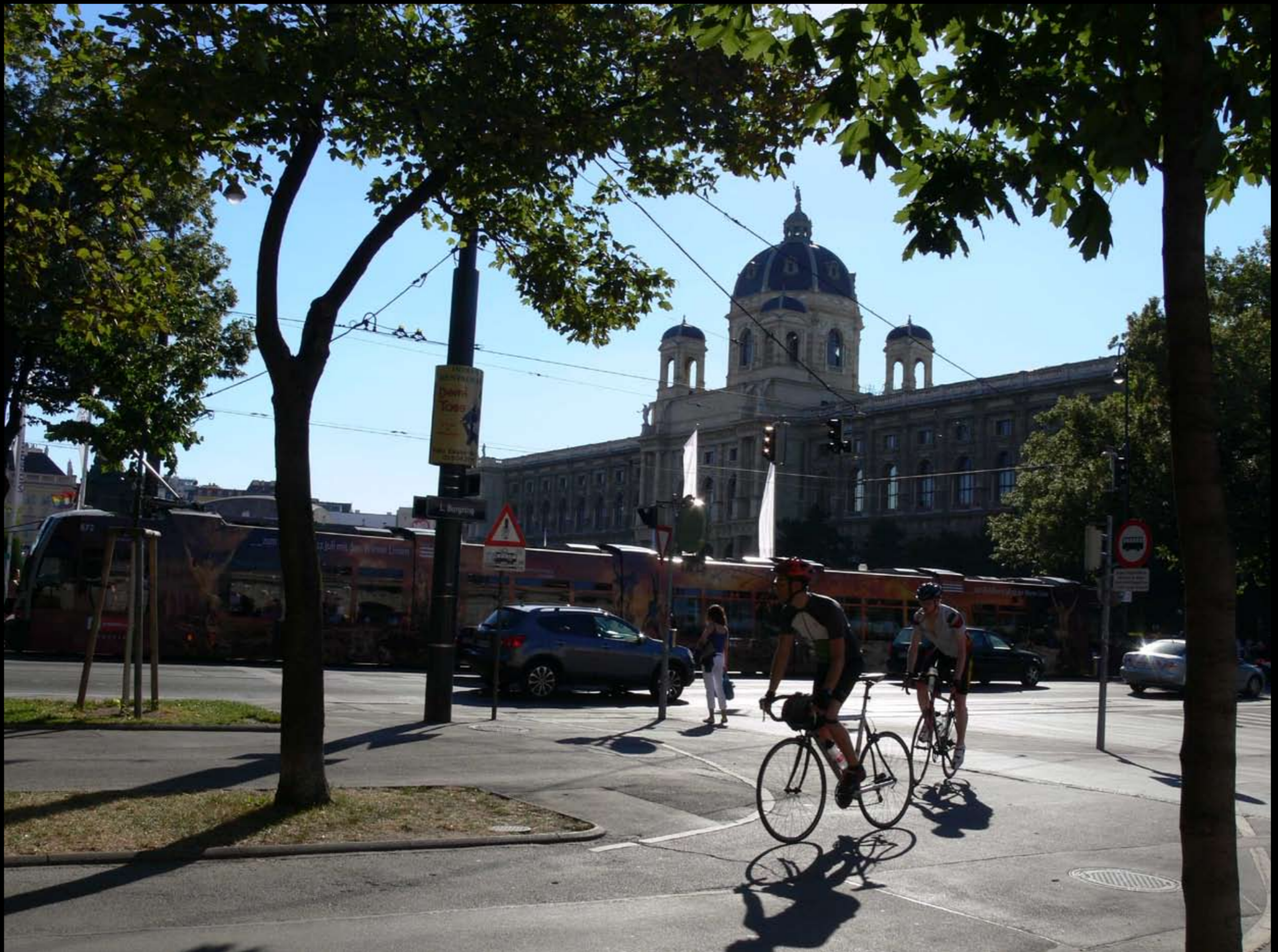
Blick zum Naturhistorischen Museum