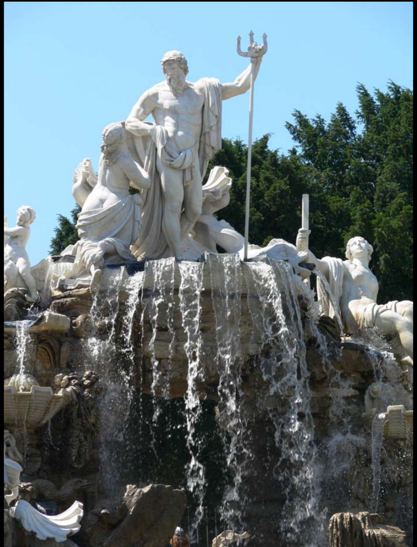
Neptunbrunnen im Schloss Schönbrunn