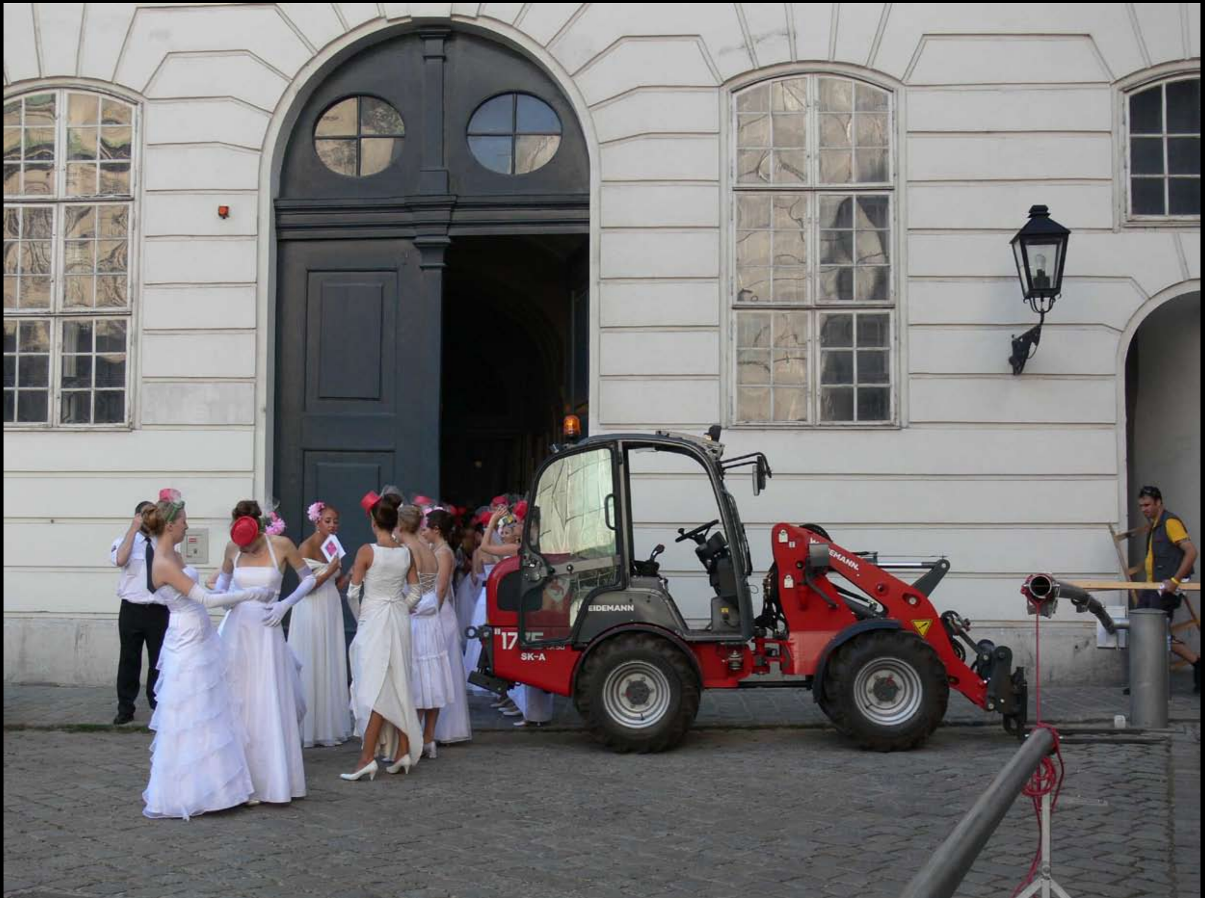
Blick hinter die Kulissen der Fete Imperiale