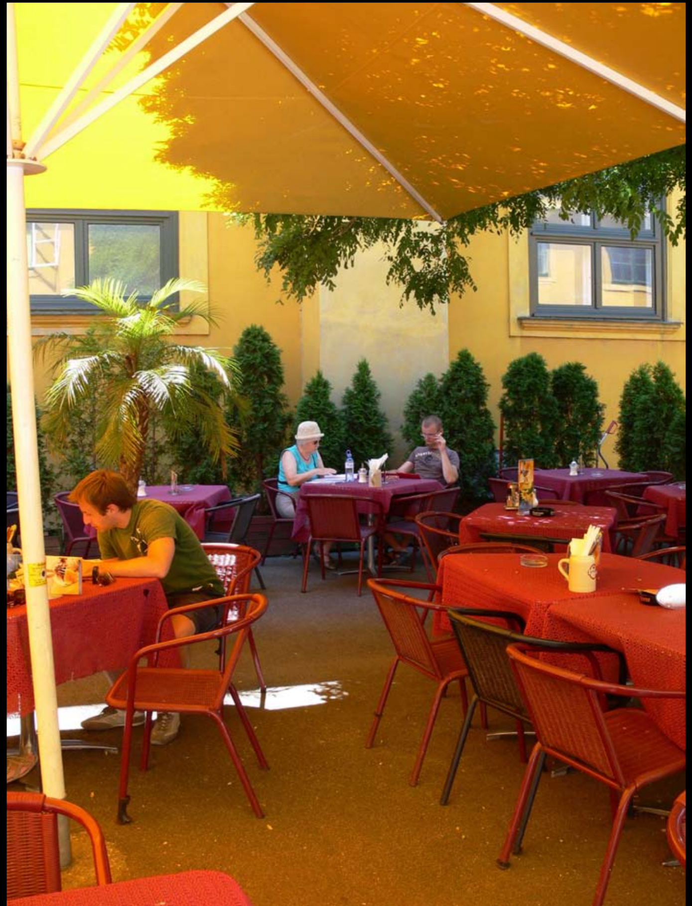
Rotorange im Schloss Schönbrunn