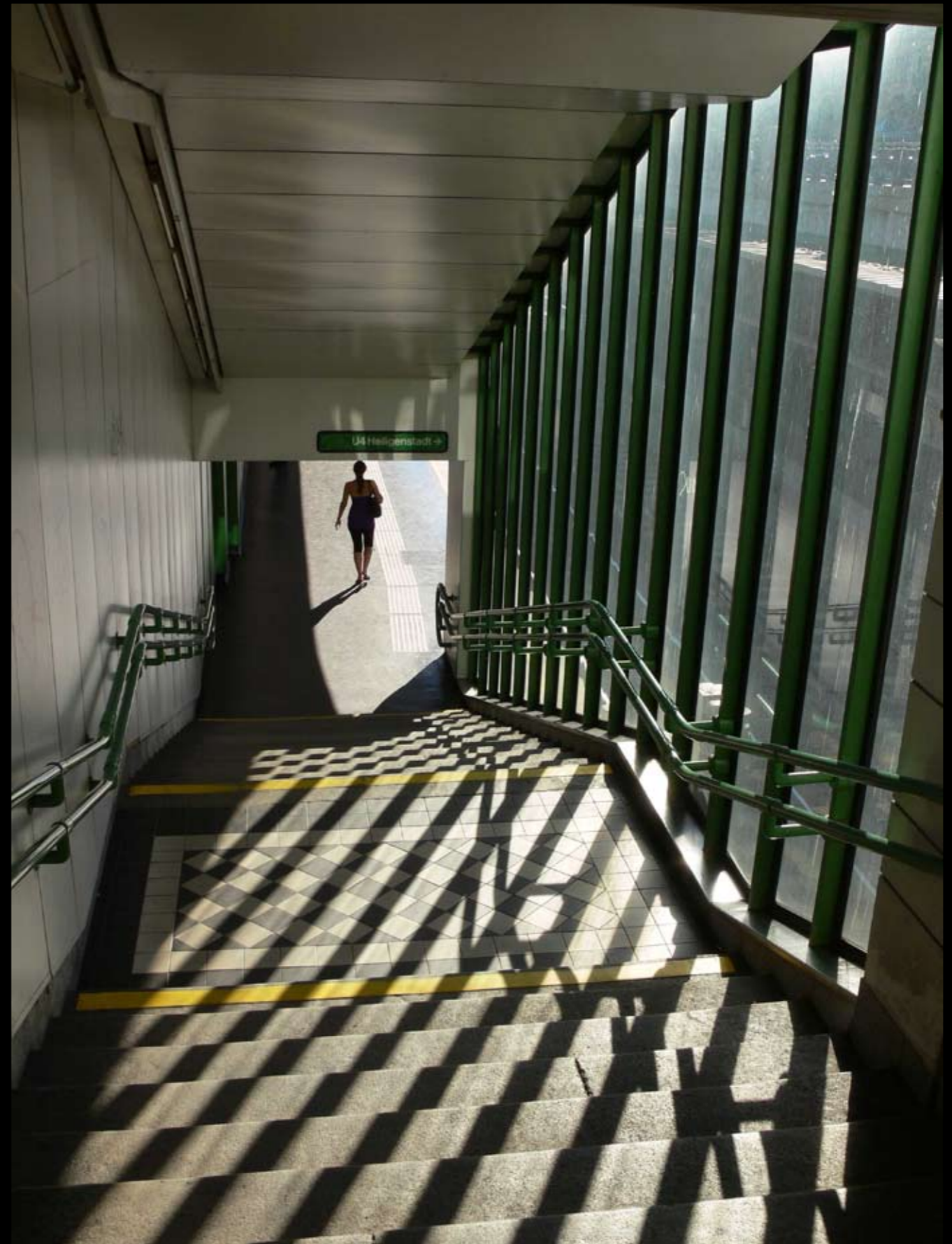
Licht und Schatten