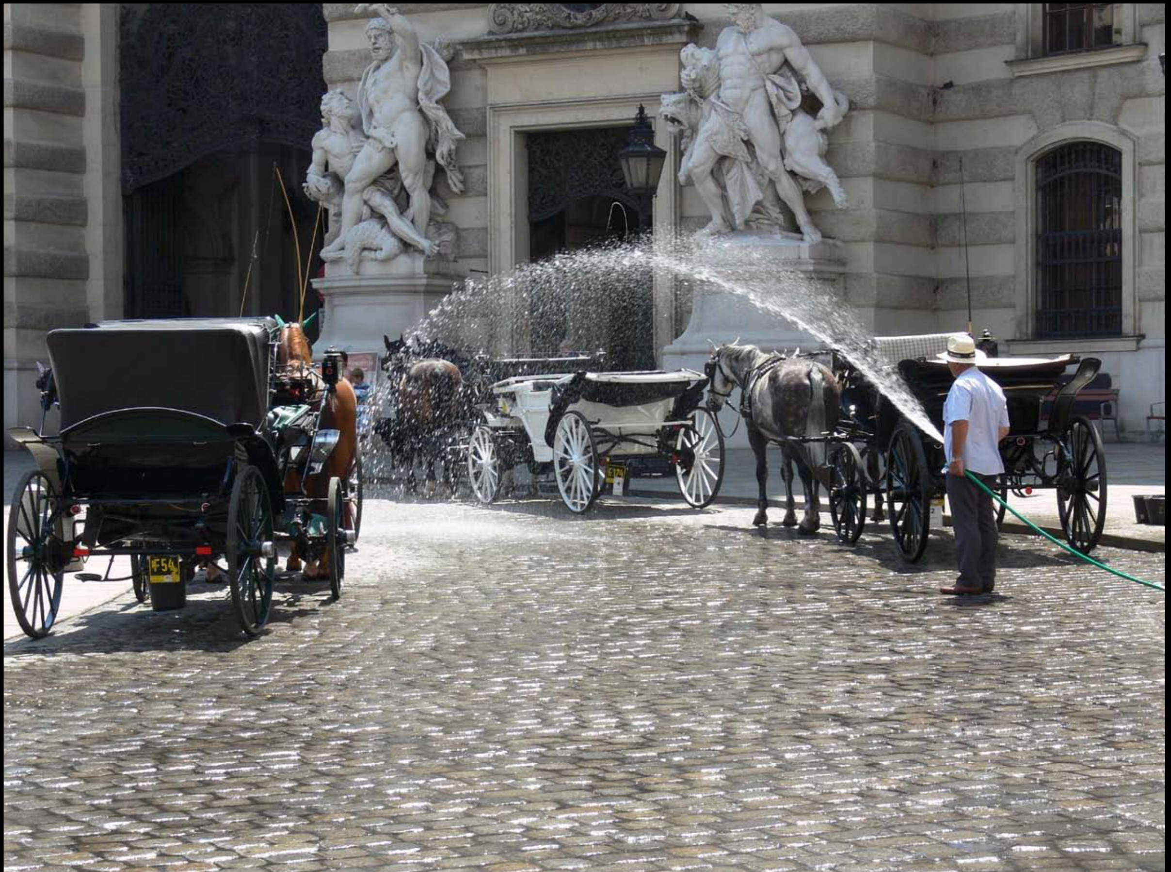
auch die Fiaker schwitzen im Juli in Wien