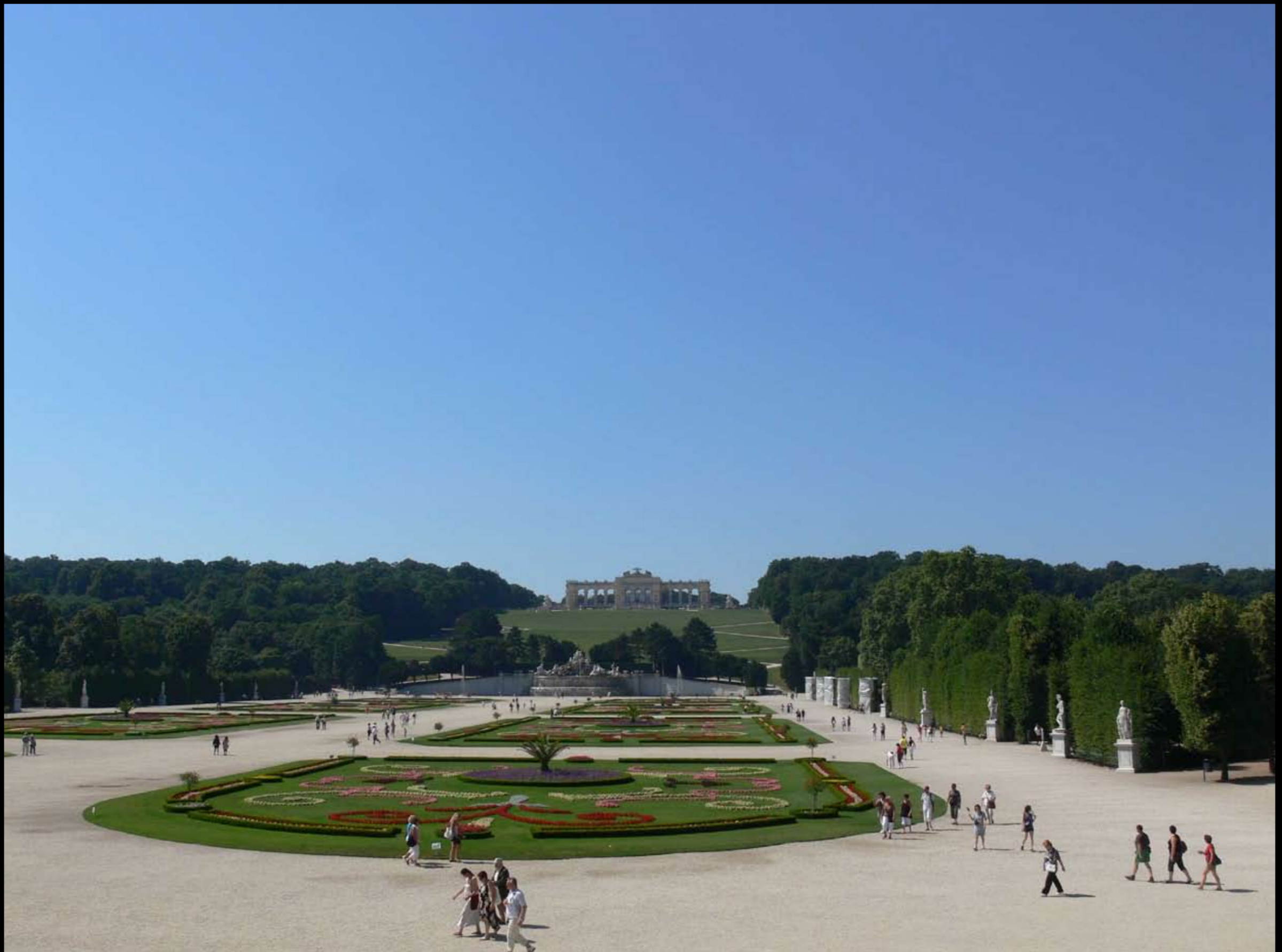
Blick auf die Gloriette aus Schloss Schönbrunn