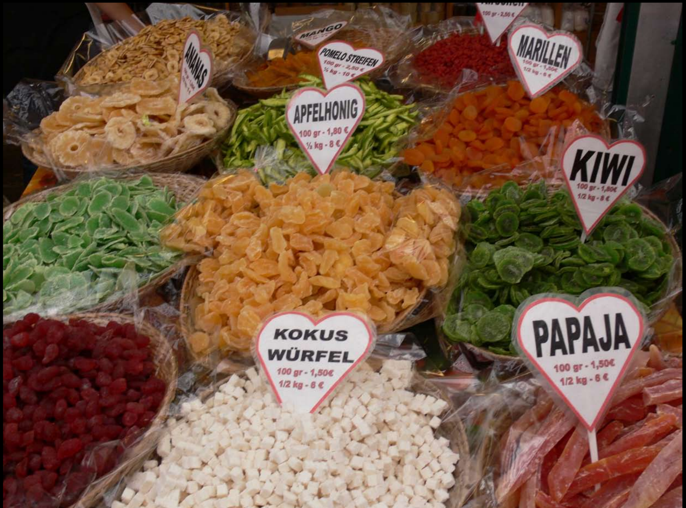
zum Naschen am Naschmarkt