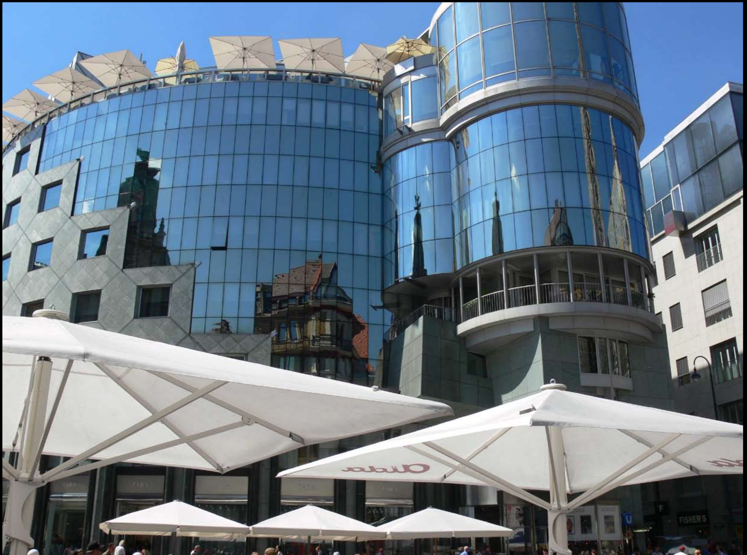
gespiegelt und beschirmt